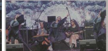
A dance and orchestra performance by delegates from Iran.