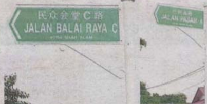
SULTAN Selangor menitahkan semua papan tanda jalan menggunakan bahasa Cina di Shah Alam diturunkan.