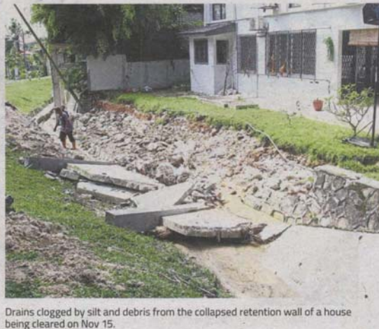
Drains clogged by silt and debris from the collapsed retention wall of a house being cleared on Nov 15.