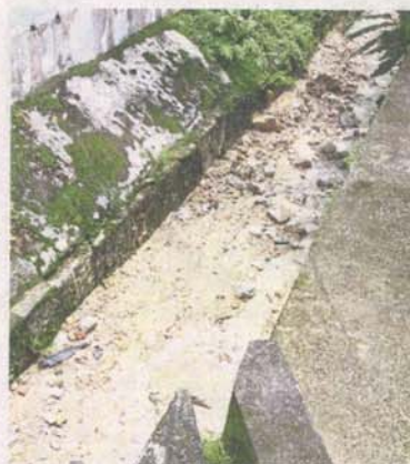
The monsoon drains in Ukay Heights are clogged up with silt.