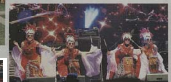
The Indonesian team presenting a unique semi-cultural dance.