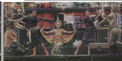
An elaborate cultural performance by dancers from Thailand.