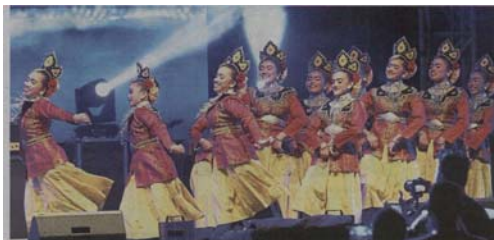
Students of STARPS Sri Aman, Petaling Jaya representing Malaysia with a traditional Malay dance performance.