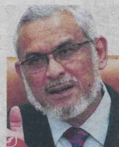
KHALID ABDUL SAMAD

Beliau mengulas titah Sultan Selangor, Sultan Sharafuddin Idris Shah yang menitahkan agar papan tanda jalan yang mempunyai tulisan Cina di Selangor ditanggalkan dan diganti dengan papan tanda jalan satu bahasa iaitu bahasa Melayu sahaja.