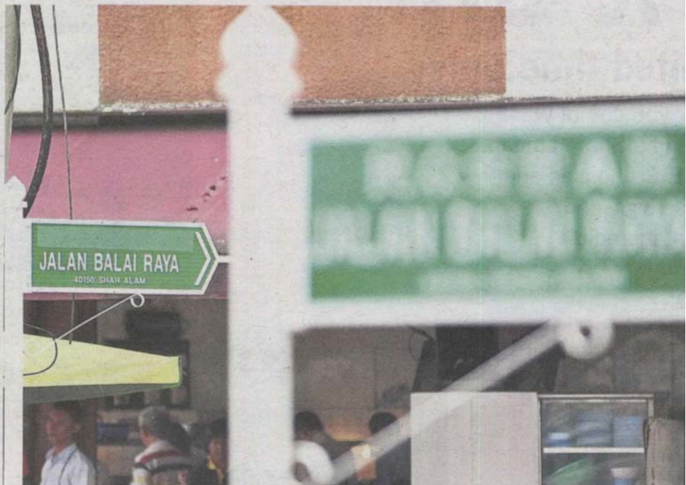
Signs of the times: Chinese characters on a road sign along Jalan Balai Raya Section U6 in Shah Alam appears to be taped over before the signs are replaced.

The council, in its reply to the Twitter user, explained that the meeting of the Selangor local government committee on Jan 13 last year had decided on the use of road signs with two languages, besides the romanised script.