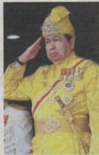
SULTAN Selangor, Sultan Sharafuddin Idris Shah mahu papan tanda jalan hanya guna Bahasa Melayu.