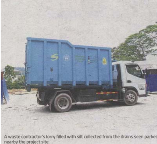
A waste contractor's lorry filled with silt collected from the drains seen parked nearby the project site.

MPAJ press relations officer Norhayati Ahmad confirmed that the monsoon drains had been cleared to prevent flash floods from recurring.