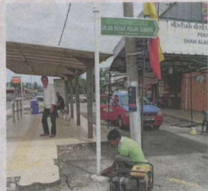
PETUGAS MBSA sedang memotong papan tanda Jalan Besar Pekan Subang yang menggunakan dwibahasa.