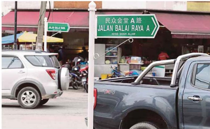
Dual-language road signs in Seksyen U6, Shah Alam.

"MBSA upholds the decree of the sultan of Selangor and will replace the road signs," said Shahrin. A resident here had uploaded a post on Twitter questioning the use of dual-language road signs in the city where the