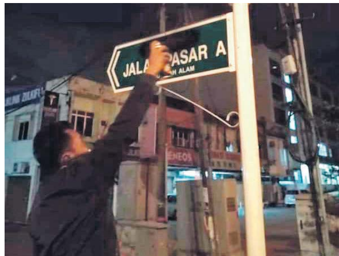
Gambar seorang individu menyembur cat hitam pada papan tanda tulisan Cina yang tular di media sosial, semalam.

“Untuk makluman, tindakan segera telah diambil oleh pihak MBSA dengan menanggalkan papan tanda berkenaan di loka-