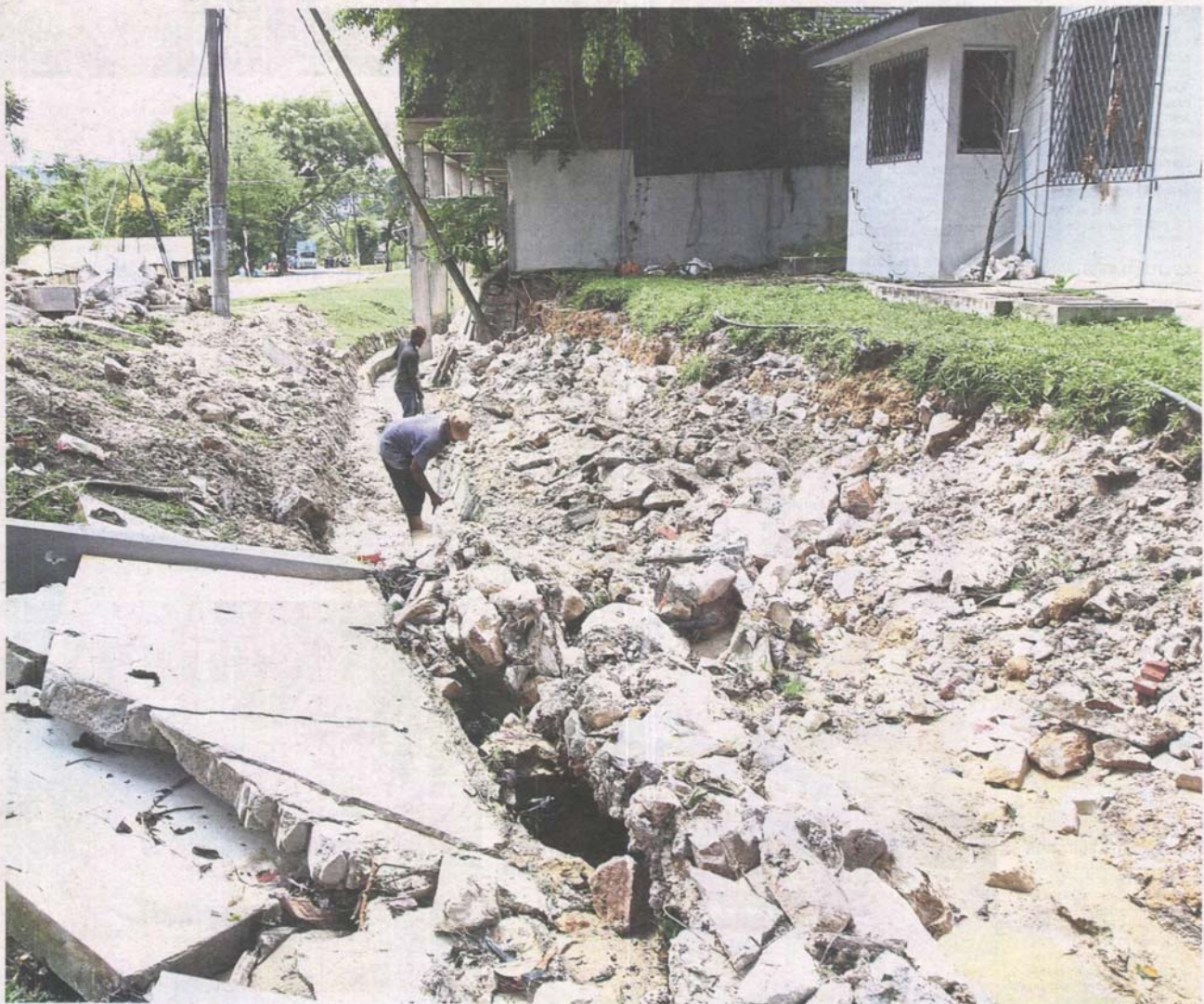
Major damage: Workers clearing silt and debris from a collapsed retention wall of a home in Taman Ukay Heights following a mudflow on Nov 11.

Following a recent mudflow in Taman Ukay Heights, Ampang Jaya, the Housing and Local Government Ministry plans to study ways to stop flash floods caused by project sites. >2&3