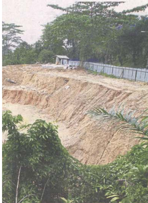
Ukay Heights residents claim that 60,000 tonnes of soil have been dumped at the project site. The loose soil washed down during a downpour affected houses in Taman Ukay Heights.