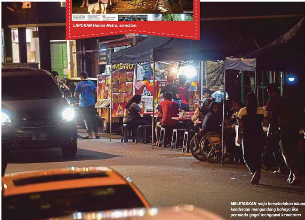
MELETAKKAN meja bersebelahan laluan kenderaan mengundang bahaya jika pemandu gagal mengawal kenderaan.