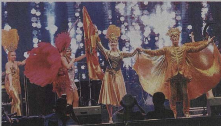
Even far-away Finland was represented at the International Folklore Festival.