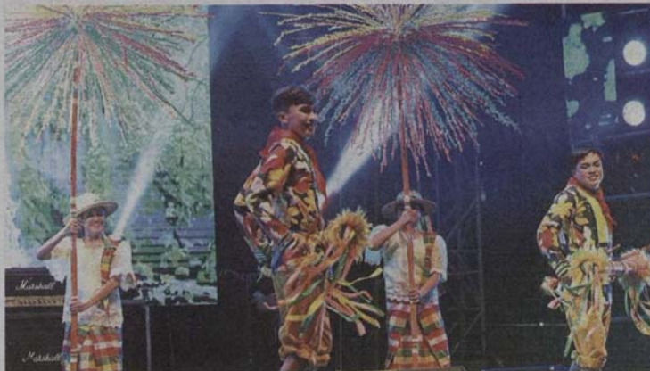
A Filipino folk dance by delegates from the Philippines.