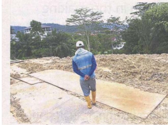
Ukay Heights residents say tonnes of soil are being dumped at the project site.