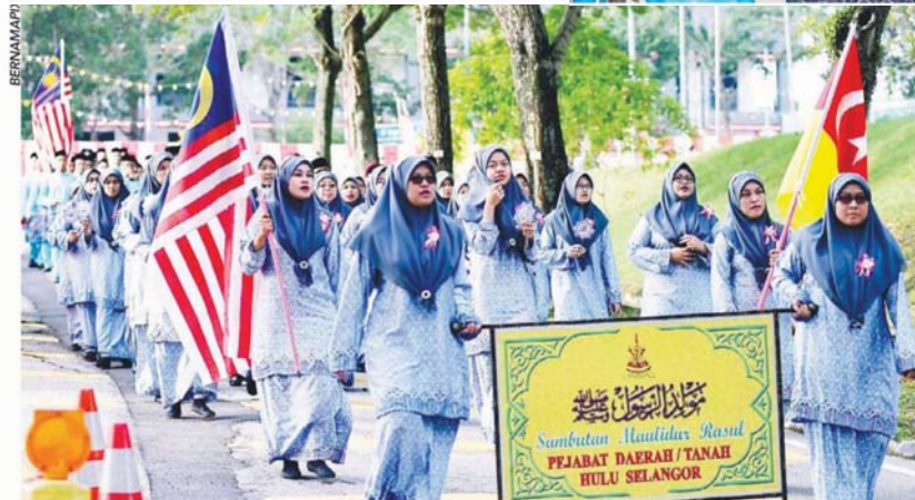
A contingent from the Hulu Selangor Land Office participating in the Maulidur Rasul procession to the Malawati Stadium in Shah Alam, Selangor.