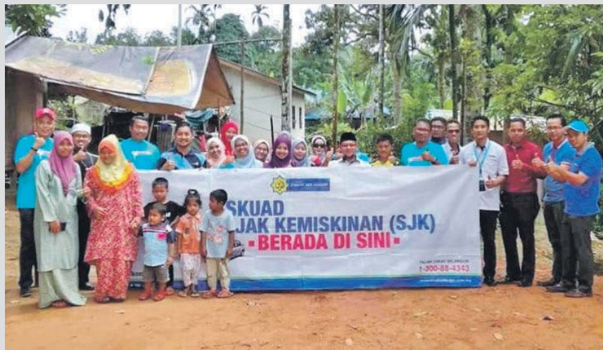
Syarikat keluar zakat mendekati keluarga asnaf masyarakat Orang Asli.