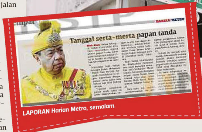
LAPORAN Harian Metro, semalam.