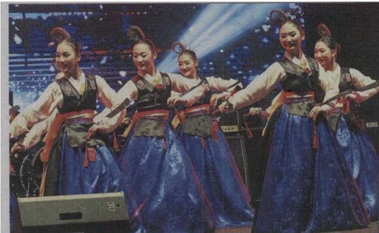
A South Korean traditional dance performance.