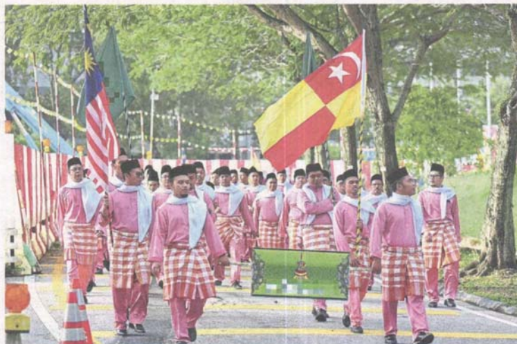
Proud participants: One of the Selangor contingents taking part in the Maulidur Rasul procession from Shah Alam Stadium to Melawati Stadium.