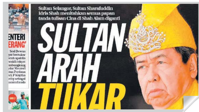
Laporan muka hadapan Sinar Harian, semalam.