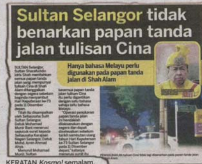
KERATAN Kosmo! semalam.

Cina digantikan dengan papan tanda jalan menggunakan bahasa Melayu sahaja.