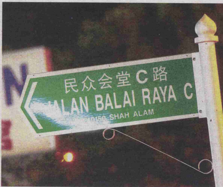
PAPAN tanda jalan bertulisan Cina yang dititahkan oleh Sultan Selangor agar ditanggalkan dan hanya menggunakan bahasa Melayu.